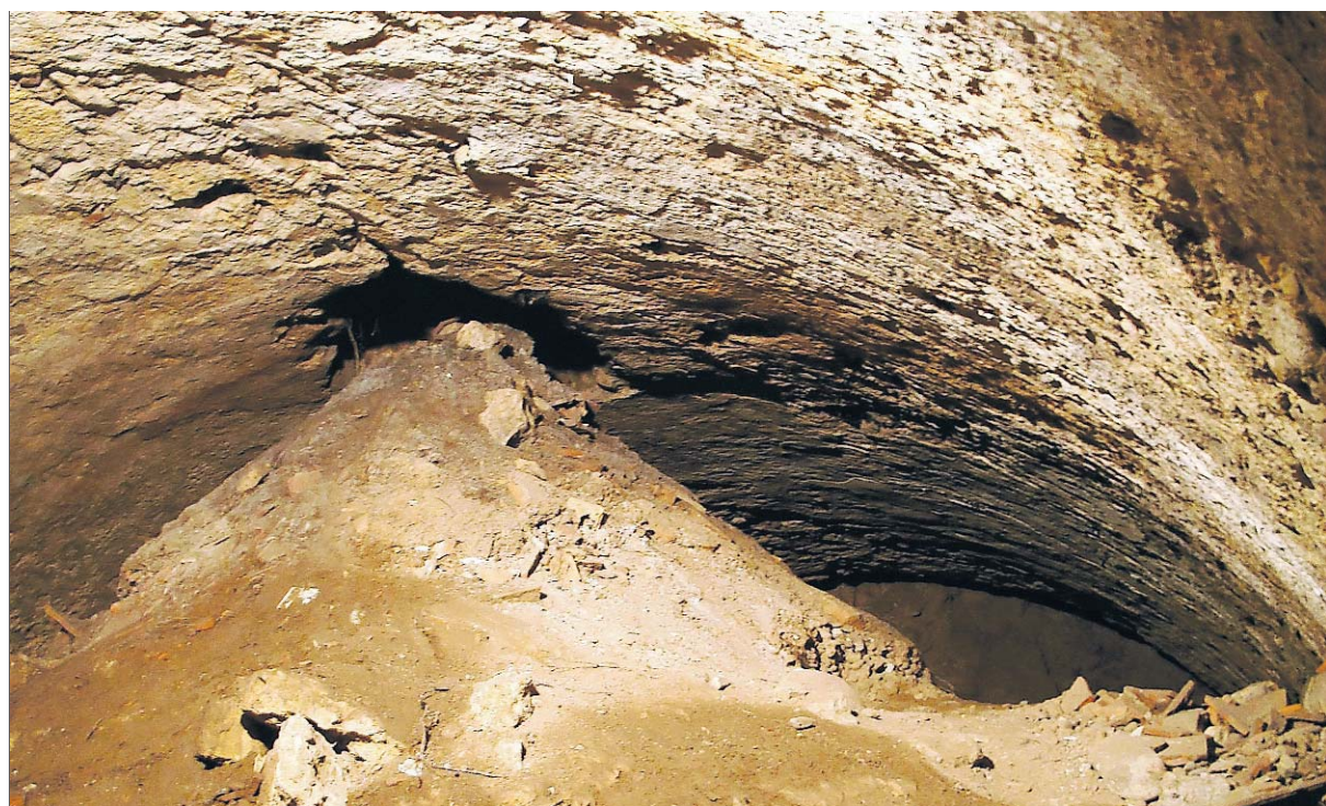
VERSCHÜTTET Der «Mammut-Keller» als Teil der Meyerschen Stollen im Aaraauer Untergrund.

Das Gericht gab dem jungen Mann teilweise recht. Es ging davon aus, dass er zumindest bei den ersten drei Bestellungen tatsächlich nicht gewusst hatte, was er da via Internet wirklich geordert hatte. Bei der letzten Bestellung sei ihm das aber klar gewesen. Damit habe er sich der Widerhandlung gegen das Betäubungsmittelgesetz schuldig gemacht. Verurteilt wurde er zu einer bedingt erlassenen Geldstrafe von 100 Franken sowie zu einer Busse in derselben Höhe. (TO)