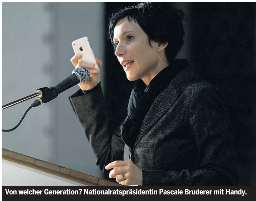
Von welcher Generation? Nationalratspräsidentin Pascale Bruderer mit Handy.

Nicht zuletzt wegen ihres Einsatzes von modernen Mitteln wie Internetauftritten für Projekte der Vermittlung zwischen den Generationen zählt sich Bruderer selbst auch nicht zu den «Digital Immigrants», sondern sieht sich irgendwo dazwischen.